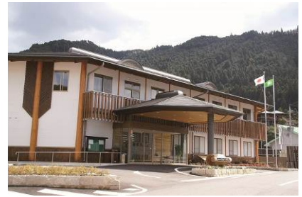
●清水行政局（有田川町清水387-1）