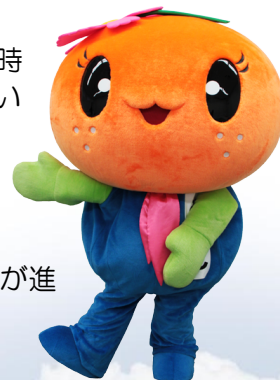
有田川Library イメージキャラクター “ありりん”

なお、配点は第1次から第3次試験までの総合得点方式ではなく、段階が進むごとにその都度成績はクリアされます。