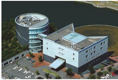
●古備庁舎（有田川町下津野2018-4）