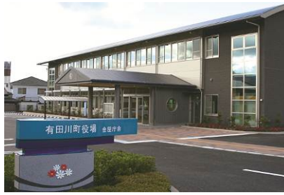
●金屋庁舎（有田川町中井原136-2）