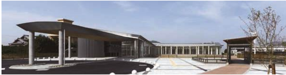
●“本のあるカフェ”地域交流センターALEC（有田川町下津野704）