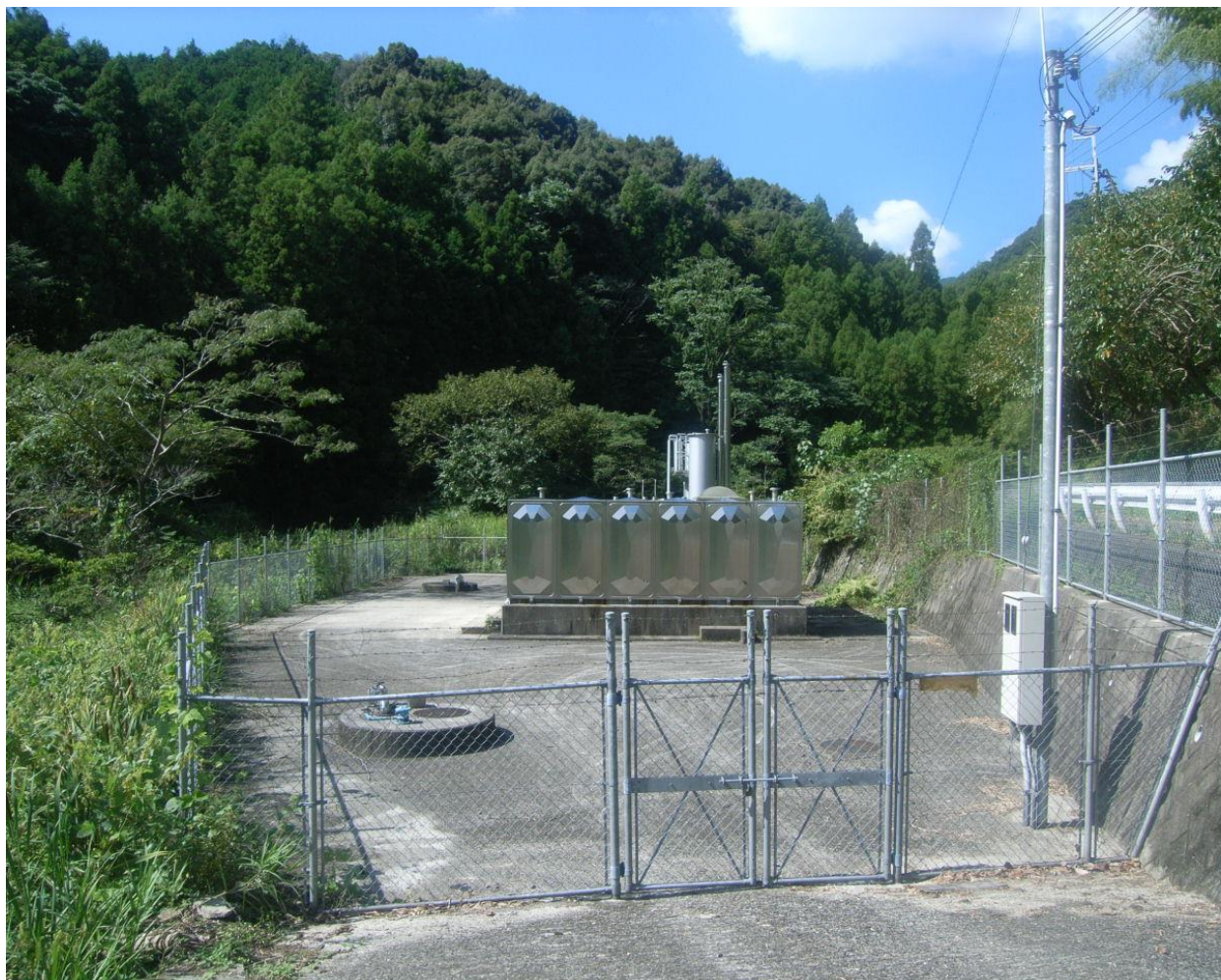
吉原簡易水道（修理川配水区）修理川浄水場