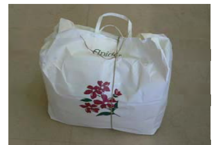
(裏面もご覧下さい。)