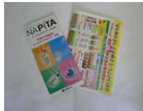
ダイレクトメール