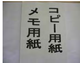
コピー・メモ用紙