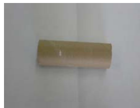
トイレトペーパーの芯