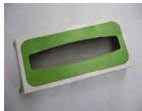
ティッシュの紙箱