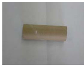
トイレトペーパーの芯