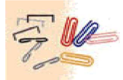
異物を取り除いて