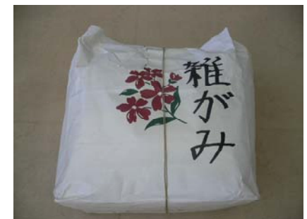
(裏面もご覧下さい。)