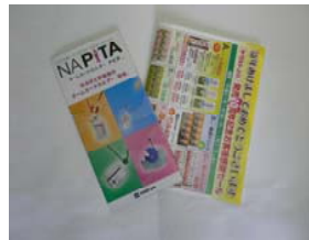
ダイレクトメール