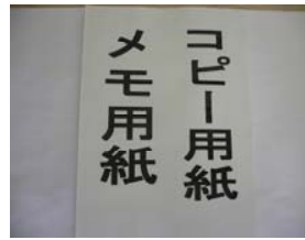
コピー・メモ用紙