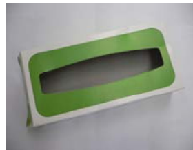
ティッシュの紙箱