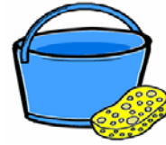
プラ製バケツ スポンジ