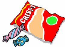
お菓子の袋・飴等