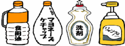
ペットボトル以外のプラ容器 (中身を残さず使い切り、水洗いして出して下さい。)