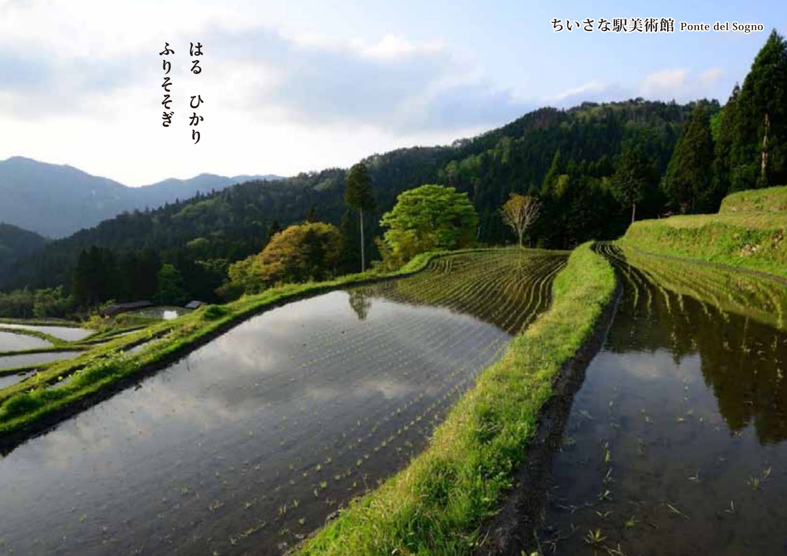
「さとやまさん」アリス館