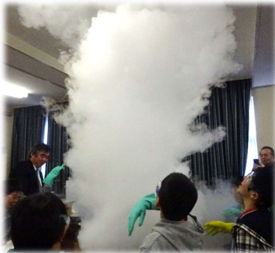
←タコもこんなたくさん並ぶとキレイやで～。 ↑バクハツちゃうでw