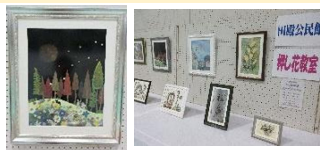
令和7年度 文化祭展示作品