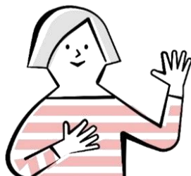
主任ケアマネジャー