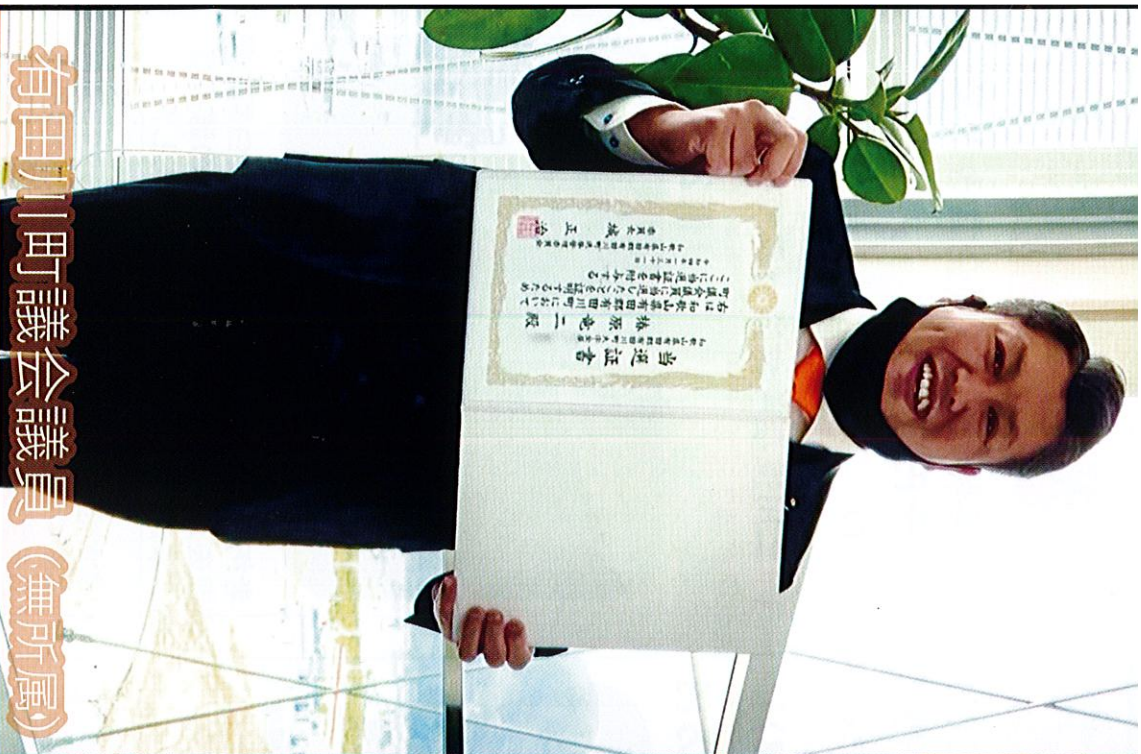
有田川町議会議員 (無所属) 有田川町議会議員 (無所属)