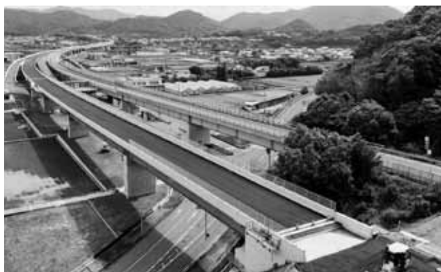
御坊 IC 付近の様子