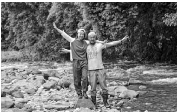
秘密のお気に入りの場所でパシャリ☆

都市部の若者などが過疎地 域などに移住して、おおむね 1年以上3年以下の期間、地 場産品の開発、農林水産業へ の従事などの地域協力活動 を行いながら、地域に定住・定 着を図る取り組みとして、総 務省により「地域おこし協力 隊」制度が創設されています。