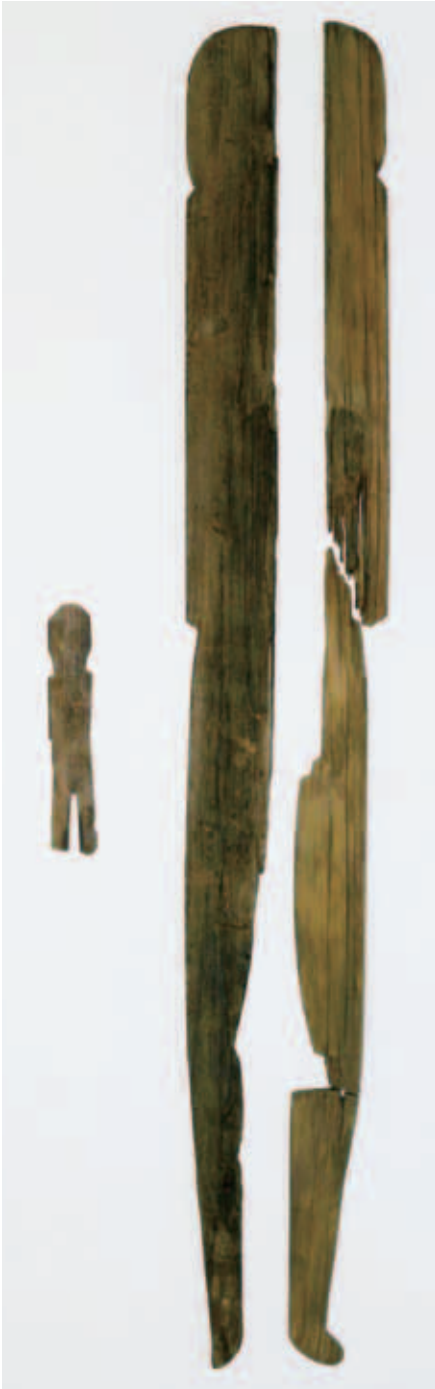
野田地区遺跡出土の人形 左：15.6 cm 右：85.8 cm

人形とは、文字通り人の形をかたどったもので、紙や木などさまざまな素材で作られています。野田地区遺跡の人形は、ヒノキの薄い板に切り込みを入れて、頭や肩、足などを表現しています。大きさも大小あり、小さなものは15cmほど、大きなものは1mを超えるものが出土し