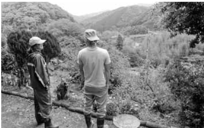
家の庭から見えるのは心安らぐ風景