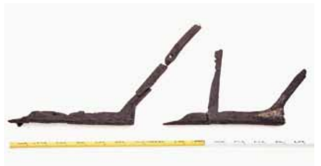
野田地区遺跡出土の犁 (メジャーの黄色部分が1mを示します)

野田地区遺跡出土の犁を初めとして県内各地の遺跡から発見された農耕具と、民俗資料から紀州の農具の歴史を振り返る企画展が紀伊風土記の丘で開催中です。ぜひご覧ください。