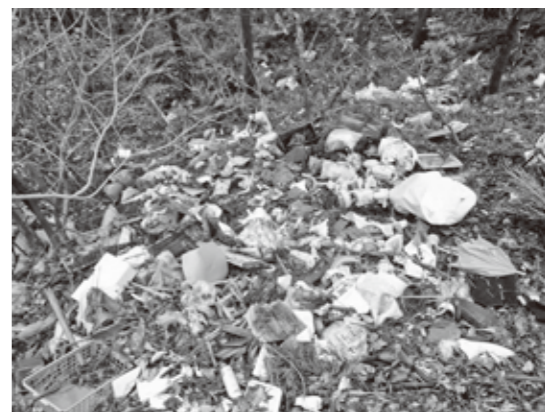
不法投棄される大量の廃棄物

和歌山県では、廃棄物不法投棄対策として監視カメラの設置と監視パトロールを行い、それを周知することで不法投棄の抑制につなげています。しかし、依然として不法投棄