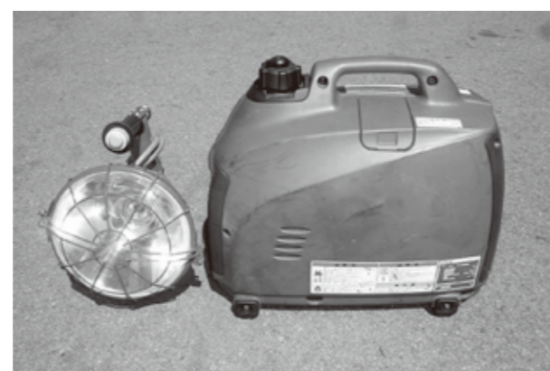
発電機の例(右部分)

する。また、ボンベカバーまで覆うような大きな鍋や鉄板は使用しない。放射熱でボンベが熱せられ、爆発する恐れがあります。 ・小型発電機の運転中の排気ガスには一酸化炭素が含まれているため、屋内では使用しない。屋外で使用する場合でも、風通しの悪い場所では一酸化炭素中毒になる恐れがあるので、風通しの良い場所で使用しましょう。