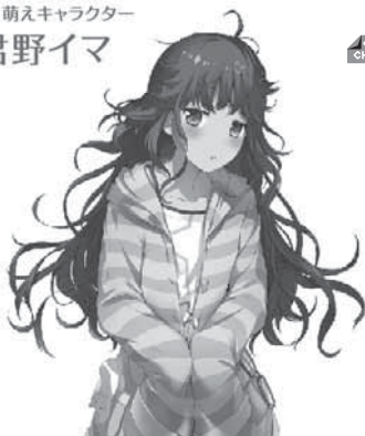
COOL CHOICE イメージキャラクターとして「君野イマ」「君野ミライ」が活動中