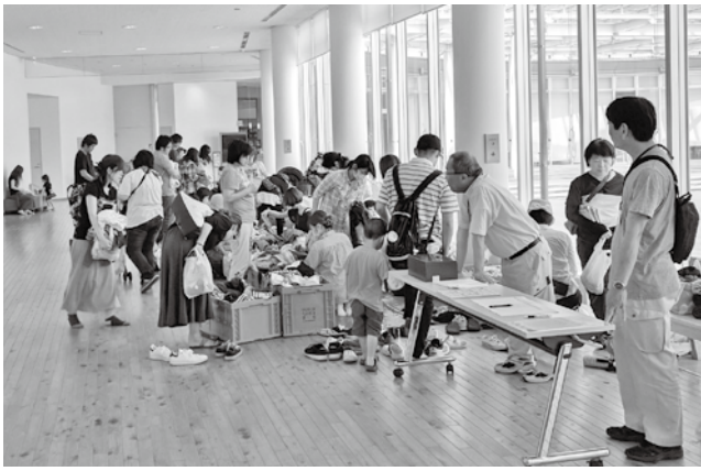
子ども用の古着バザーの様子

保護者の皆さまから「要らないが、捨てるのはもったいない」という古着を無償でご提供いただき、子ども服が必要なご家庭でリユース(再利用)することで、ごみの減量にもつながります。