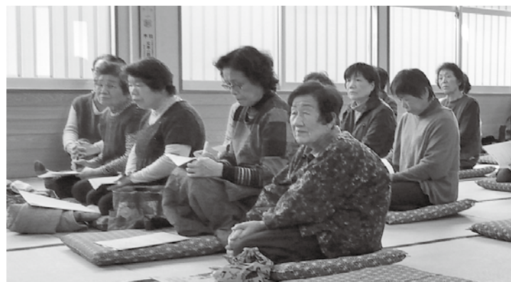
平成29年度に井口地区（上写真）、金屋地区（下写真）で開講した際の様子