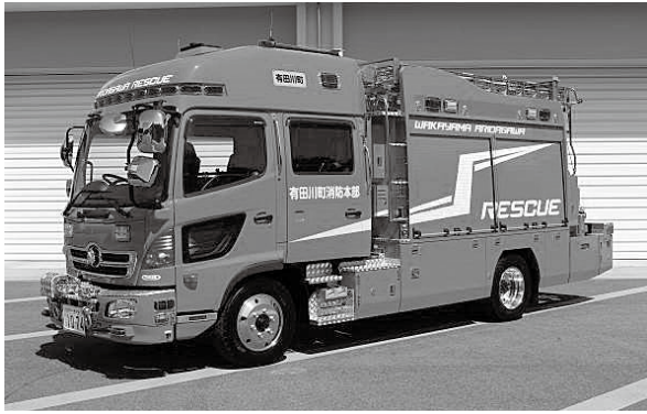
新しくなった救助工作車。多様な事故・災害現場に対応できるようになりました。