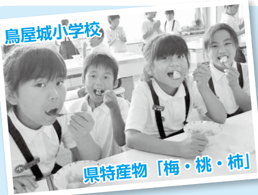
県特産物「梅・桃・柿」

農林水産物が豊富な和歌山県。地域の農産物を学習に利用することで、子どもたちの食に対する感謝の気持ちや郷土への理解を深めることができました。梅は梅ジュースにし、桃・柿は自分たちで食べやすいように調理し、おいしくいただきました。