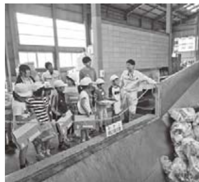
職員の説明を聞く八幡小学校と久野原小学校の4年生。そのまなざしは真剣そのもの。

4月19日(火)、八幡小学校と久野原小学校の4年生が合同でプラスチック収集場を見学しました。