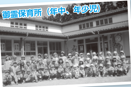
御霊保育所 (年中、年少児)