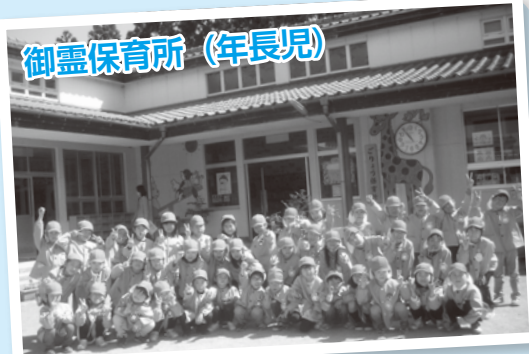
御霊保育所 (年長児)