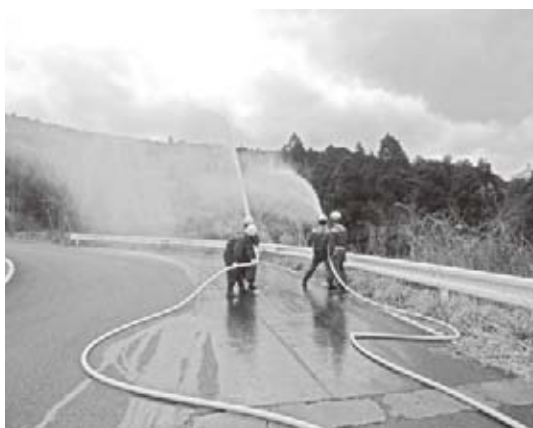
火災想定訓練の様子

3月13日(日)清水支団第3分団と大蔵地内の山林で、火災が発生し延焼拡大しているとの想定で、消防隊員と消防団員が連携して、山中の道約800mを中継送水しながら長距離放水訓練を実施しました。