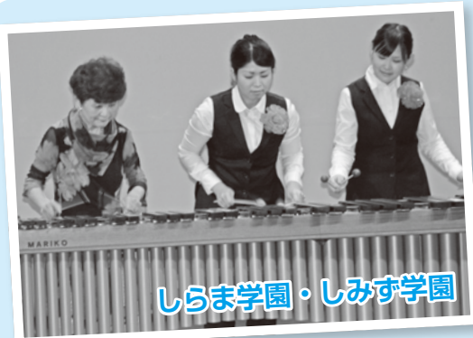
しらま学園・しみず学園

「ジブシーヴァイオリンコンサート」 弦を押さえる左指の速さに子どもたちは圧倒され、児童の列ごとに練り歩いての演奏に感動していました。様々なテクニックを駆使して、音色で感情を表現し子どもたちを楽しませてくれました。