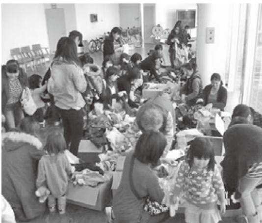
「リユース子供服バザー」の様子