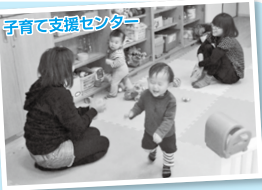
子育て支援センター

センターでは、親子で遊びながら情報を交換したり、友達をつくったり交流しています。子育てに困ったり、悩んだりしたときも相談員が相談にのってくれますので、気軽に遊びに来て下さい。