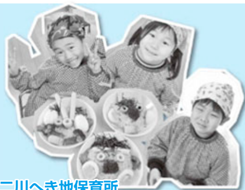
二川へき地保育所

年長児が七段飾りの「おひなさま」の飾りつけをしました。どれをどこに置くのが難しかったけれど、みんなで協力して完成させました。おひなさまの歌もみんなで歌ったよ！