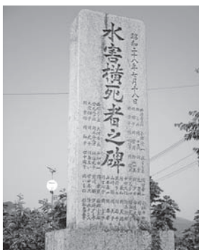
徳田区内に残る「水害横死者之の碑」毎年7月18日に徳田地区の方々が慰霊祭を営まれています。

「しまで」には近所の人たちも集まっていたのですが、次第に水位が上がってきたのです。危機的な状況に、いとこが上げた「死にたくない」と悲痛な叫び声が耳から離れませんでした。また、差し出した竹の棒をつかみながらも、家族がすでに流されてしまったことを理由に、自ら手を離した方がいました。その方は手を離すときに頭を下げて流されていったのです。