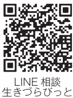
LINE相談 生きつらびっと

・月・水・金・土曜日 / 11時～16時 30分(16時まで受け付け) ・月・火・木・金・日曜日 / 17時～22時30分(22時まで受け付け)