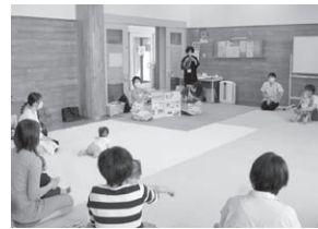
【ベビーマッサージ教室の様子】 絵本の読み聞かせなども行っています。