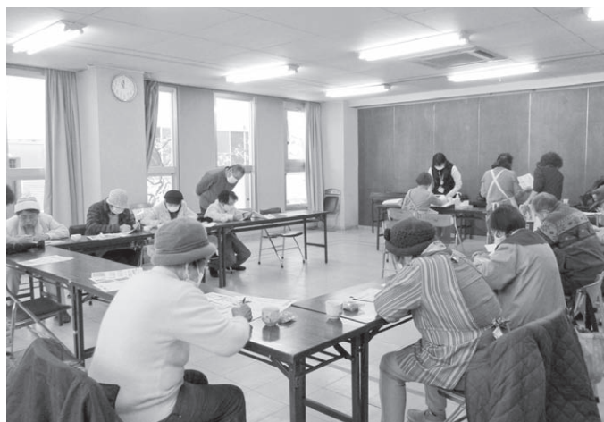
1月の「なごやかサロン」の様子。写真撮影時のみマスクを外しています。