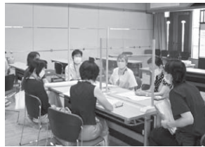
【有田川町母子保健推進員研修会の様子】