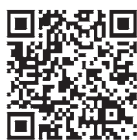
二川ダム 水位監視情報