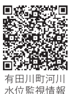
有田川町河川 水位監視情報