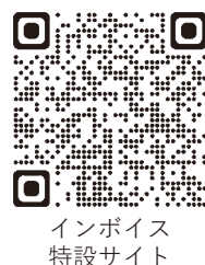
インボイス特設サイト