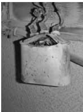
破裂したコンデンサ