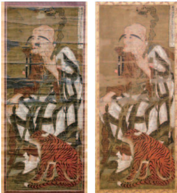
修理前(左)と修理後(右)

日本の文化財は、木や紙など自然素材のものが多く、定期的な修理をしなければ劣化して失われてしまいます。今回、先人が守り伝えてきた貴重な文化財を次世代へと継承していきたいという浄教寺関係者の思いにより、約300年ぶりとなる大規模な修理が実現しました。文化財の修理は、単に資料の保存にとどまらず、地域の歴史を未来へと引き継いで行く作業にもなります。浄教寺関係者の皆さまのご理解とお力添えに感謝申し上げます。