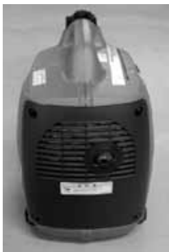
小型発電機排気部分

災害時に発電機などを使用すれば生活が便利になりますが、誤った使い方をすれば一酸化炭素中毒を引き起こし、最悪の場合死に至ります。事故を起こさないためには、「発電機を正しく使うこと」「仮に一酸化炭素中毒になっても早期に気づくこと」が大切です。