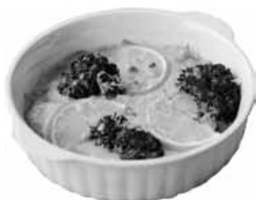
せきしたさん家の ベビーホタテ和風グラタン