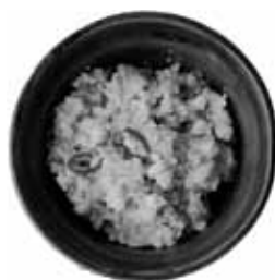
るいちゃん家の おからの卵の花煮