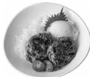
はやし家の つくねバーグ丼