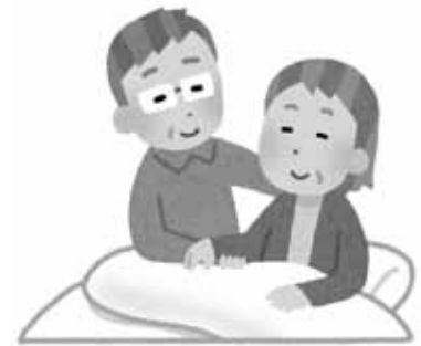
令和3年（2021年）7月利用分まで

※「現役並み所得者」とは、同じ世帯に課税所得145万円以上の65歳以上の人がいて、65歳以上の人の収入が単身の場合383万円以上、2人以上の場合520万円以上ある世帯の人をいいます。