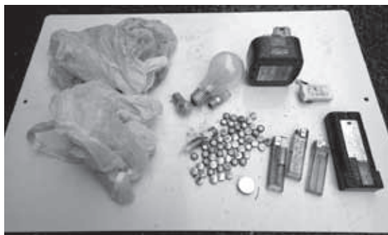
乾電池回収ボックスから取り出された混入物