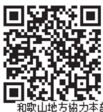
和歌山地方協力本部

本部 有田募集案内所（有田市宮崎町100-2） ☎ 0931-9931 E-mail wakayama.pco-arita@rct.gsdf.mod.go.jp