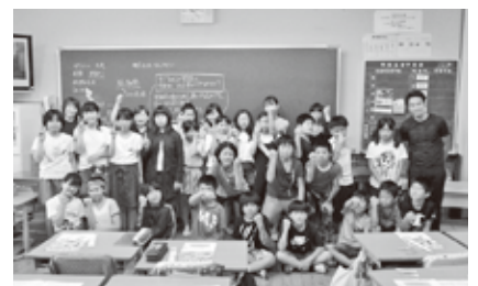
6月27日(木) 御霊小学校6年生松組