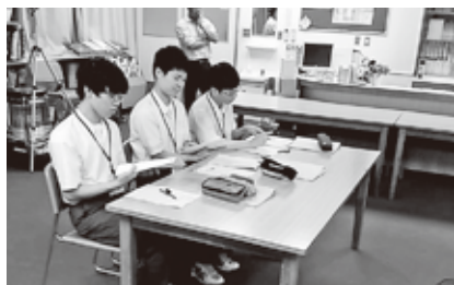
6月27日(木) 有田中央高等学校清水分校3年生