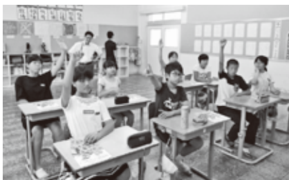
6月20日(木) 石垣小学校6年生

有田川町では多くの児童・生徒の皆さんが、授業の一環として「認知症サポーター養成講座」を受講し、認知症を正しく理解できるよう取り組んでくれています。講座では認知症の方だけではなく、友達や家族など、誰に対しても優しい気持ちで接することの大切さについても話し合われました。