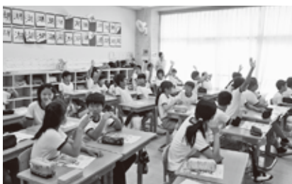
7月4日(木) 田殿小学校6年生