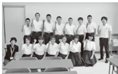
8月28日(水) 石垣中学校3年生