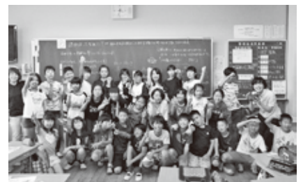
6月27日(木) 御霊小学校6年生竹組