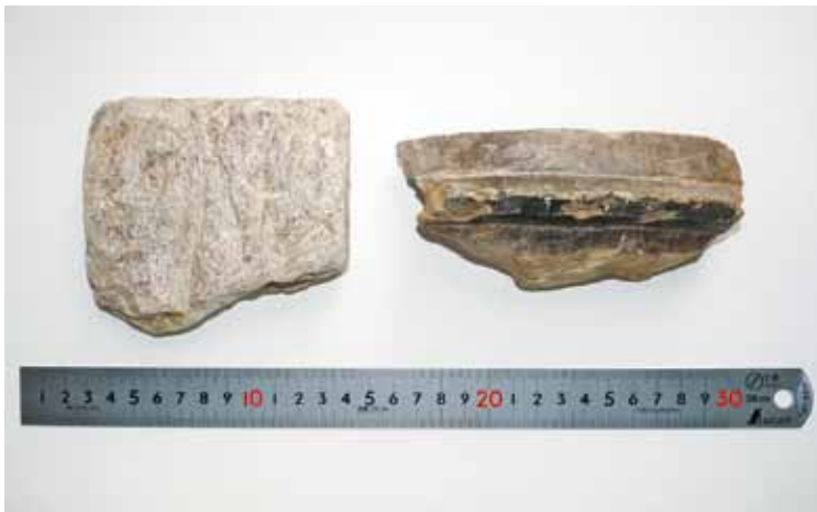
滑石製の温石（左）と石鍋（右）

温石は、元は石鍋であったものが破損した後に形を変えて再利用されていることが多く確認されています。鎌倉時代における石鍋や温石などの滑石製品は、館や寺院など有力者が関係していたと考えられる遺跡から発見されることも多く、当時としては貴重な道具であったのでしよう。