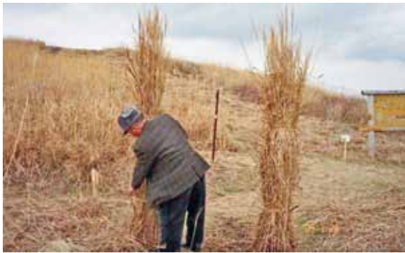
茅葺き屋根の原料となるススキ（生石山）

茅葺き屋根には、いくつかの優れた特徴があり、代表的な点としては断熱性の高さあげられます。屋根の原料であるススキなどには空洞が多く、屋根の厚みもあって、夏は涼しく冬場は暖かいといわれています。また、吸音性にも大変優れており、雨の日に茅葺き屋根の建物の中に入ると、急に雨音が聞こえなくなるほどの静けさを感じます。この他にも通気性が良いことや、葺き替えて不要になった茅は肥料として使