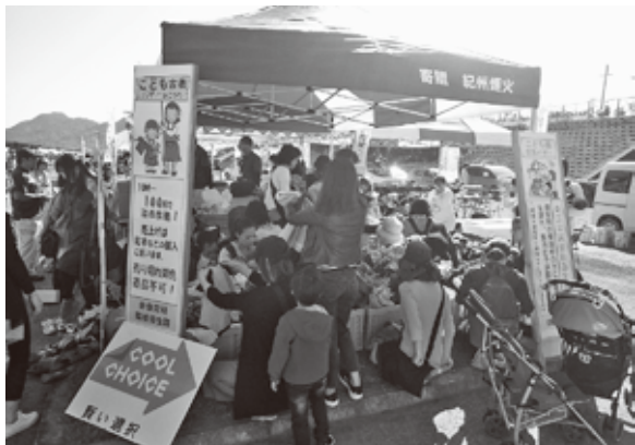
昨年のどんどんまつりの環境衛生課ブースの様子