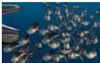
エンコドゥス類（イラスト／Takumi）