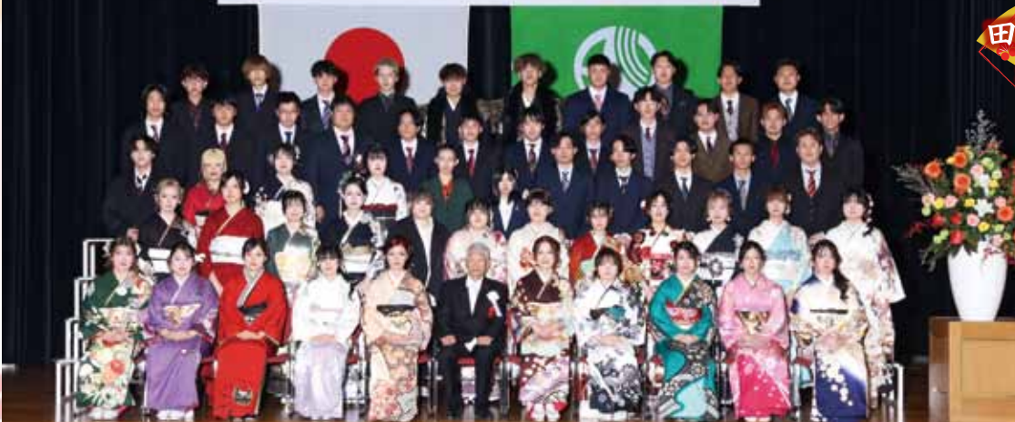
祝 令和8年有田川町二十歳の集い