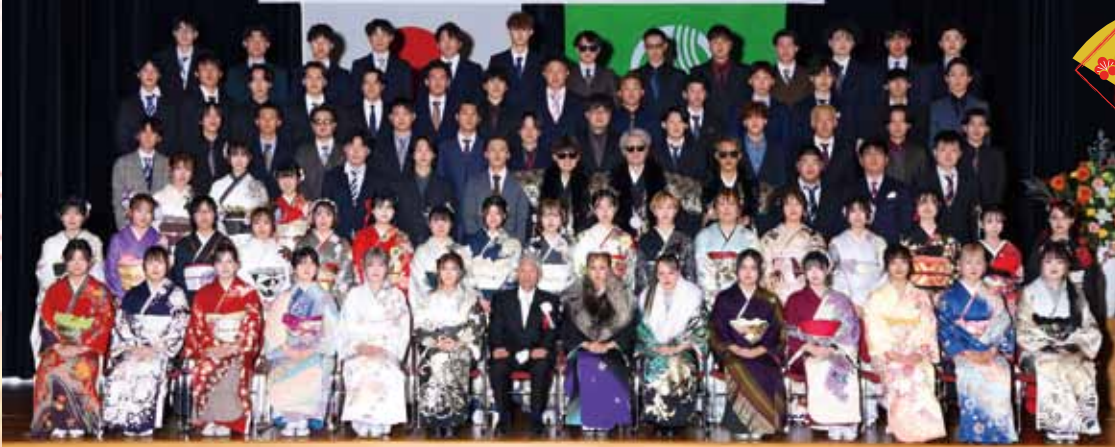
祝 令和8年有田川町二十歳の集い