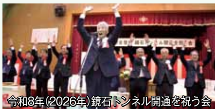
令和8年(2026年)鏡石トンネル開通を祝う会