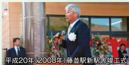
平成20年(2008年)藤並駅新駅舎竣工式