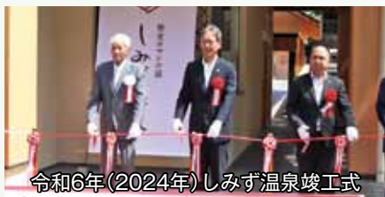
令和6年(2024年)しみず温泉竣工式