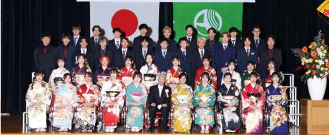
祝 令和8年有田川町二十歳の集い