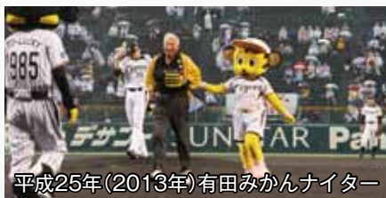
平成25年(2013年)有田みかんナイター