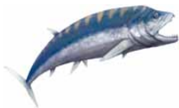
シファクティヌス（イラスト／徳川広和）