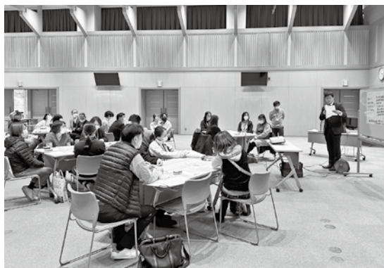
自立支援協議会の様子