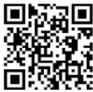
デジタル庁 YouTube チャンネル