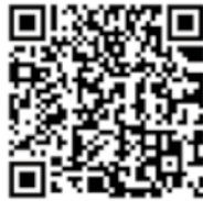
デジタル庁 ウェブサイト

問 デジタル庁国民向けサービスグループ マイナナンバーカード広報 担当 E-mail g.bangou.pr@digital.go.jp