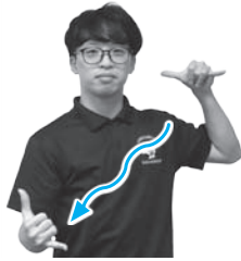
右手を揺らしながら右下へ下ろす