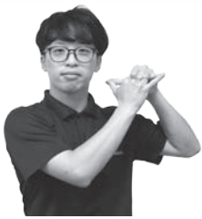
親指と小指を立てた両手を左上で合わせる