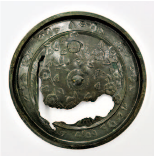
日光神社遺跡出土青銅鏡の背面（直径 11.2cm）