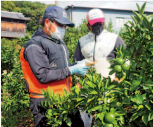
摘果を教わる研修生（左）と受入農家（右）

令和3年（2021年）に「有田川町農業後継者受入協議会」が発足し、会員の14団体が農業を学ぶ研修生の受け入れや地域の担い手問題などに積極的に取り組んでいます。